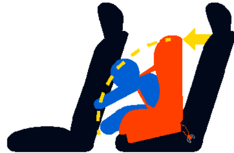
Accidente automovilístico sin usar una correa

¡Sí! Un asiento para automóvil orientado hacia adelante asegurado solo en la parte inferior puede inclinarse peligrosamente hacia adelante en un choque, lo que puede provocar que la cabeza del niño golpee el respaldo del asiento delantero, a otros ocupantes o incluso a la consola, causando daños graves. Usar la correa podría marcar la diferencia entre una lesión cerebral o ninguna lesión.