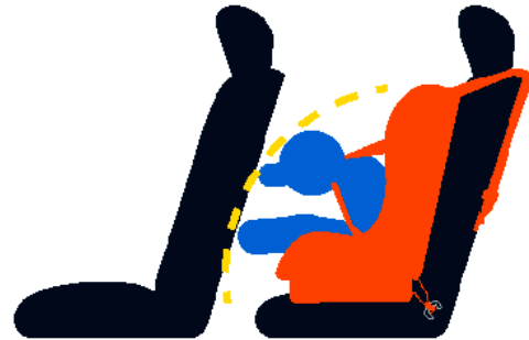
Accidente automovilístico usando una correa

Cuando se fija y se aprieta a uno de los anclajes de correa del vehículo, una correa ayuda a evitar que un asiento para el automóvil orientado hacia adelante se incline hacia adelante.